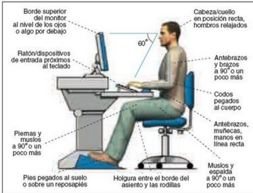
Postura de referencia para el trabajo