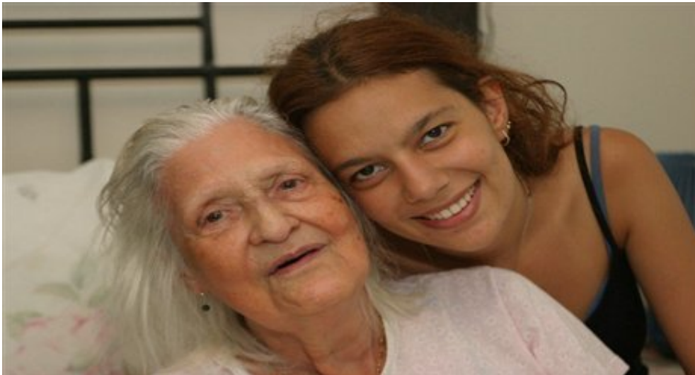
Imagen bella de mi madre amada, en esta inmensidad dulce consuelo; cuán hermosa te encuentras colocada en tu marco de rojo terciopelo.

Se reflejan de tu alma las virtudes en las pupilas de tus tristes ojos;