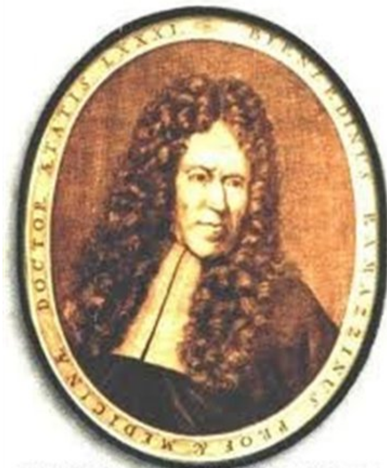
Bernardino Ramazzini, padre della Medicina del Lavoro