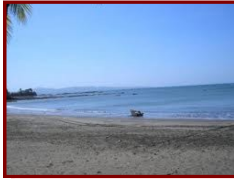
Playa Santa Catalina