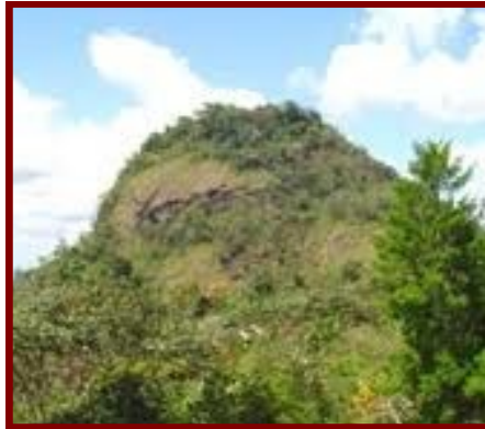
Cerro La vieja